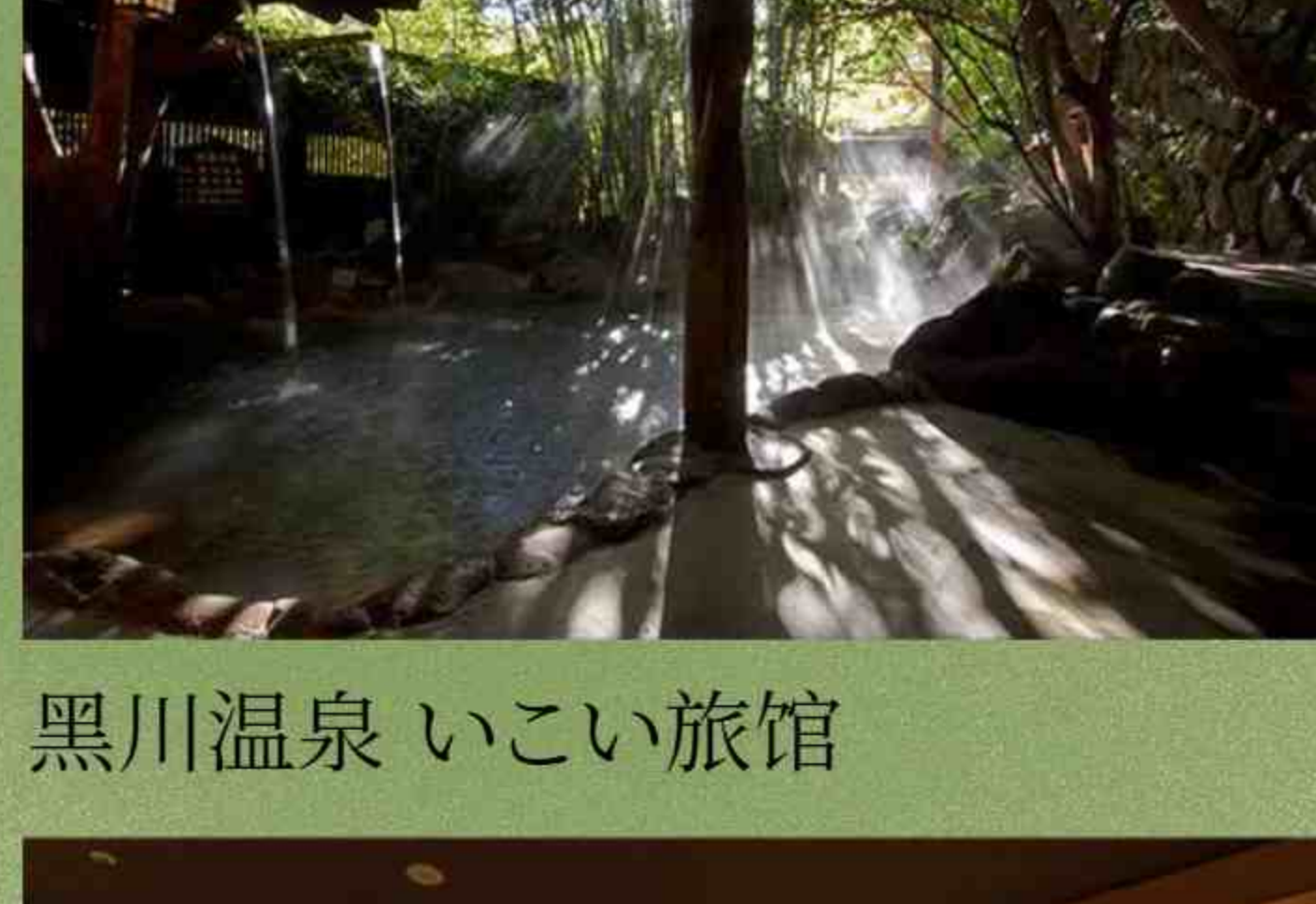
黑川温泉 いこい旅馆