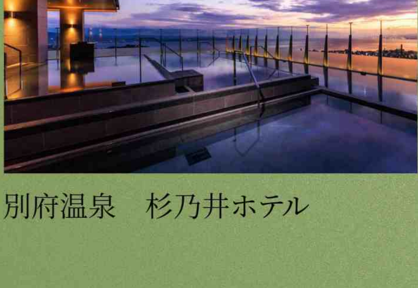
别府温泉 杉乃井ホテル