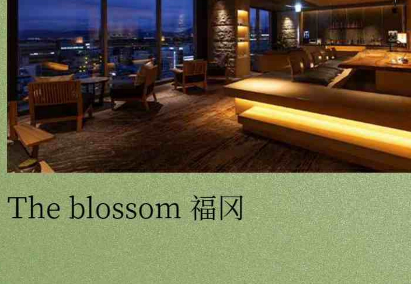
The blossom 福岡