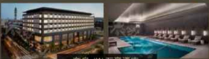
奈良 JW 万豪酒店