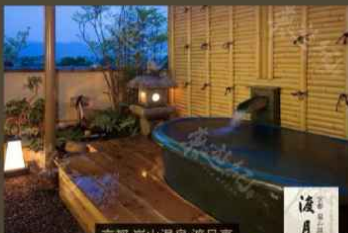
京都 嵐山温泉 渡月亭