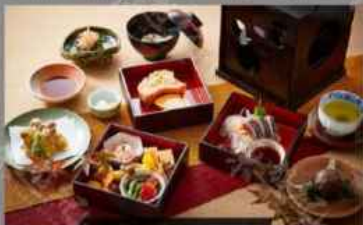
奈良日航国际酒店