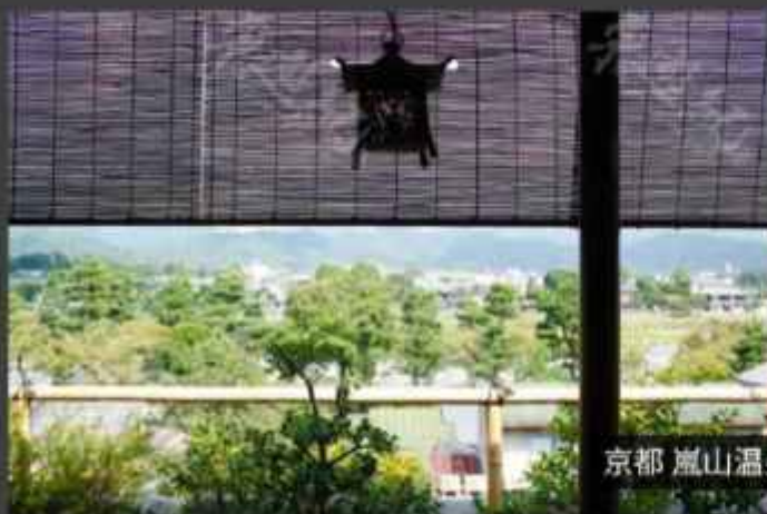
京都 嵐山温泉 波月亭